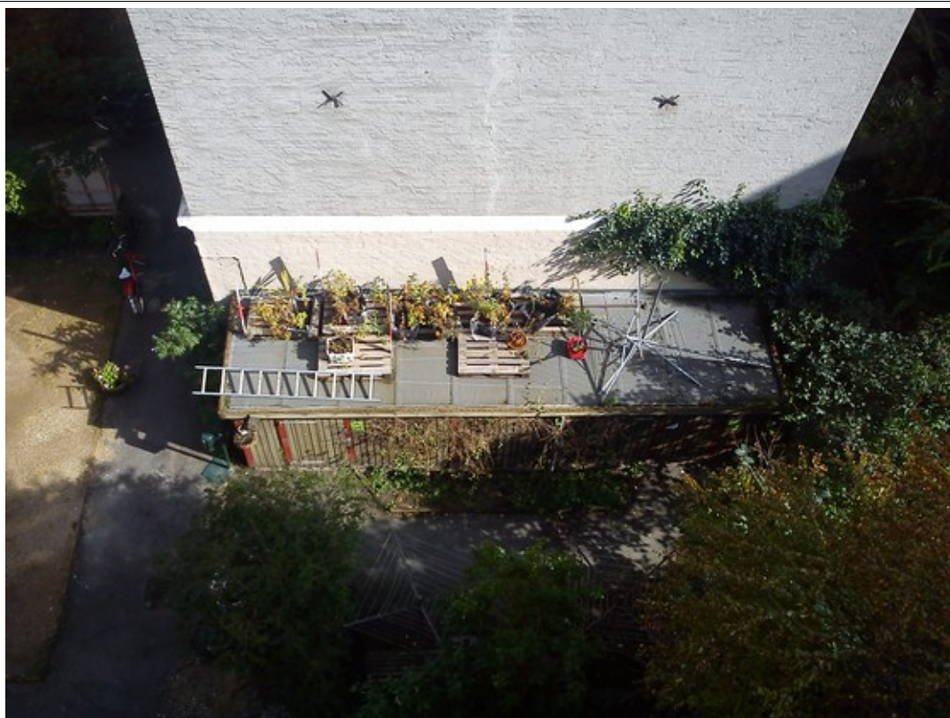
Tomatmarken set fra oven.

Ansøgning til Nørrebro Lokaludvalg 30. november 2011 Jagtgårdens gårdlaug. Udarbejdet på vegne af havegruppen af Mads, Husumgade 6, 3.tv