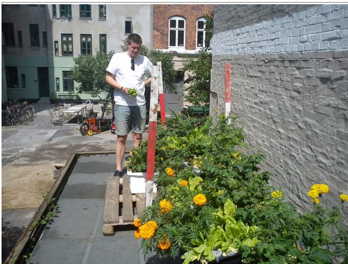
Blomsterhave, salatmark og tomater på vej.

Ansøgning til Nørrebro Lokaludvalg 30. november 2011 Jagtgårdens gårdlaug. Udarbejdet på vegne af havegruppen af Mads, Husumgade 6, 3.tv