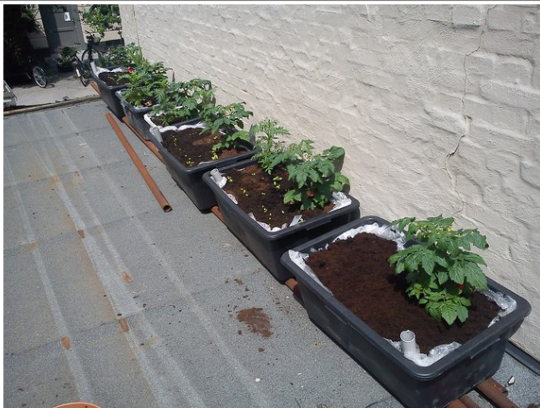
Tomaplanter i maj måned, se hvor salaten så småt spirrer op.