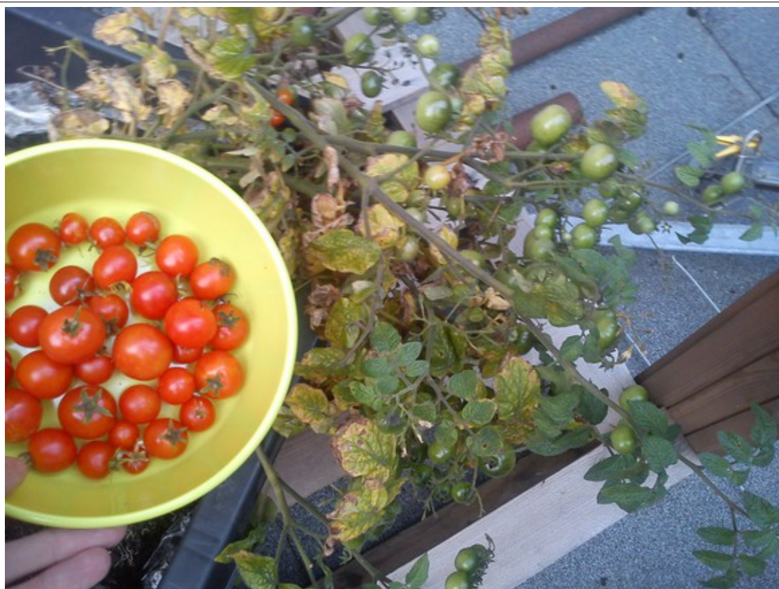
En høst af markens herligheder.